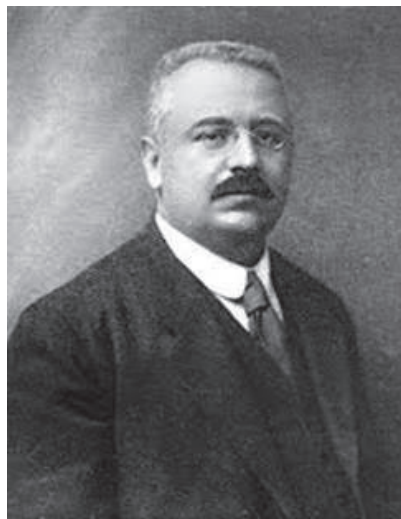
Francesco Saverio Nitti (1868-1953)

Entrato alla Camera nelle elezioni del 1904 nel segno del meridionalismo e del radicalismo democratico, Francesco Saverio Nitti intraprese inizialmente battaglie di segno non univoco, oscillando tra pragmatismo statalista e liberismo antiprotezionista, sempre però condite da una fama innovatrice capace di formulare proposte concrete per gli indirizzi di governo. Ricordando nel 1907 alla Camera, durante la discussione sul bilancio del Ministero d'agricoltura, industria e commercio, la promessa fatta da Sonnino, Nitti analizzava le cause dell'insuccesso, soprattutto come l'idea di istituire un Ministero del lavoro fosse sembrata ai parlamentari "la fine del mondo":